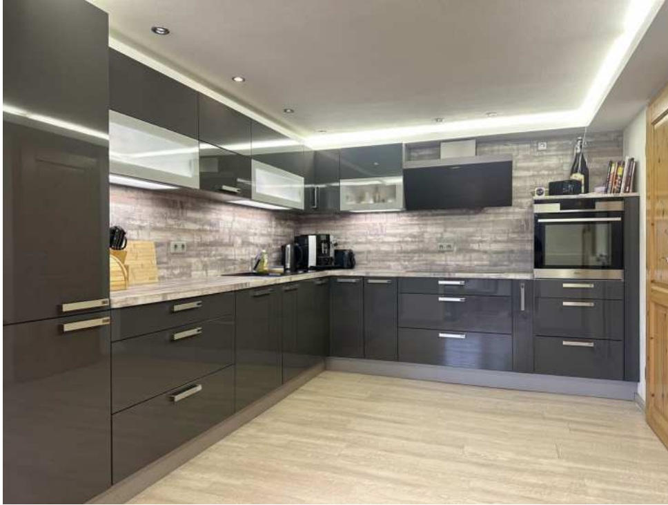
schöne große Küche