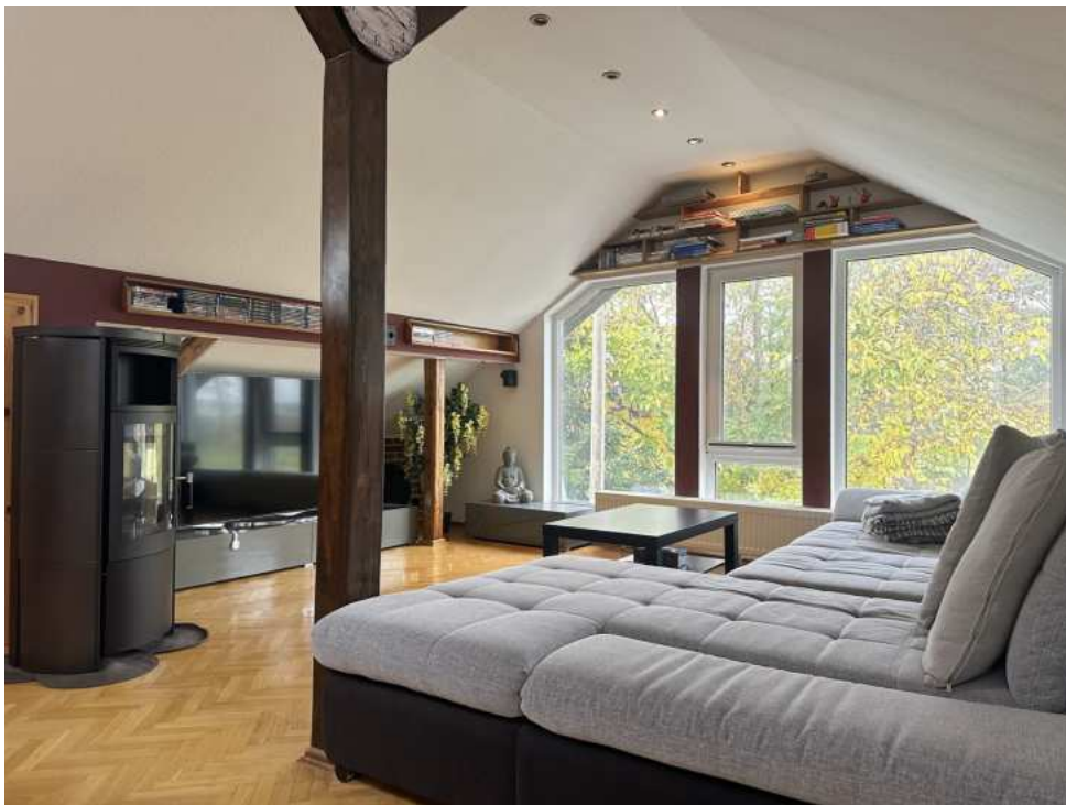
Wohnzimmer mit Blick ins Grüne