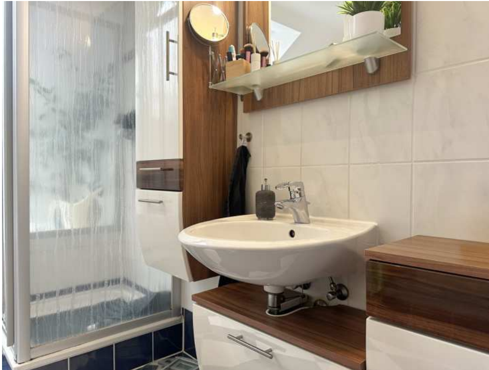
Badezimmer im Dachgeschoss