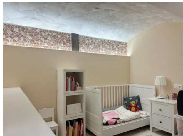
Kinderzimmer mit indirekter Beleuchtung und Gewölbe