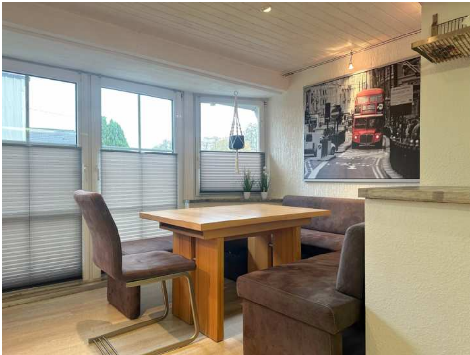
Essbereich mit viel Tageslicht