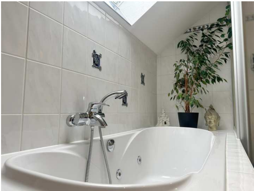
Badewanne mit Whirpoolfunktion