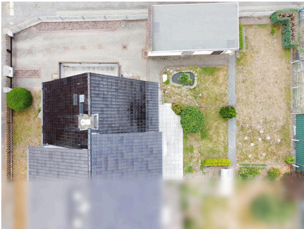
Ihr neues Zuhause aus der Luft