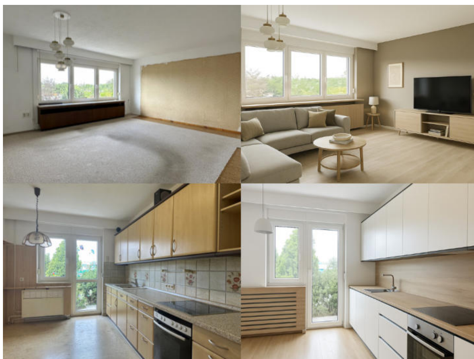
Renovierungsidee Küche & Wohnzimmer