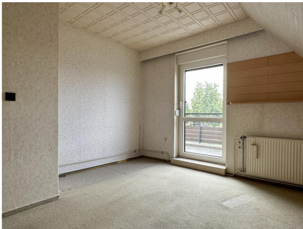
Arbeitszimmer mit Zugang zum Balkon