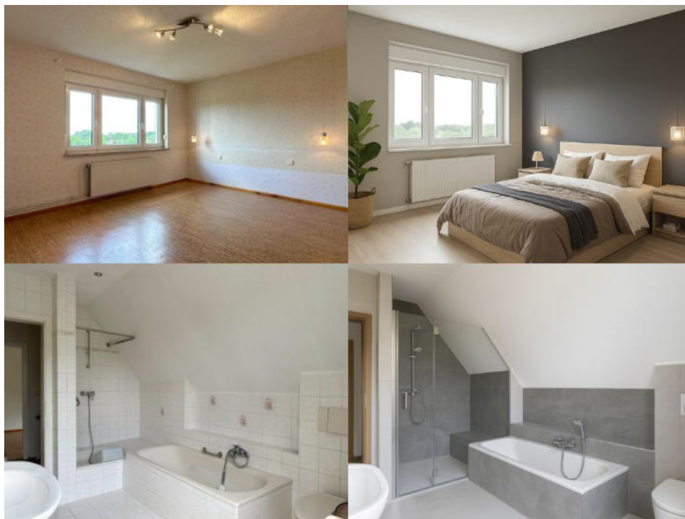
Renovierungsidee Bad & Schlafzimmer