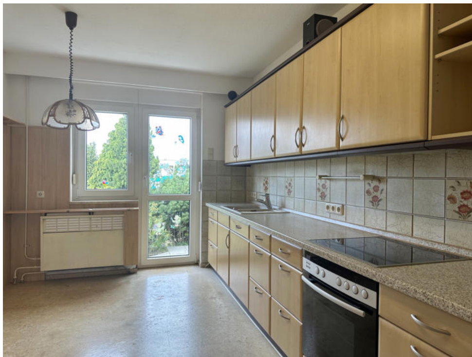
Küche mit Zugang zur Terrasse