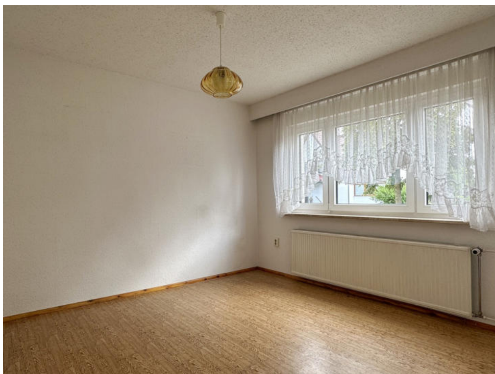
Kinderzimmer im Erdgeschoss