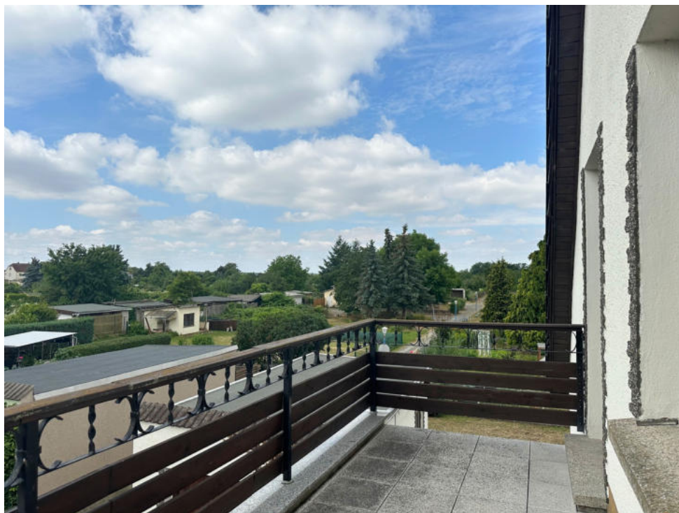
Balkon mit Blick ins Grüne