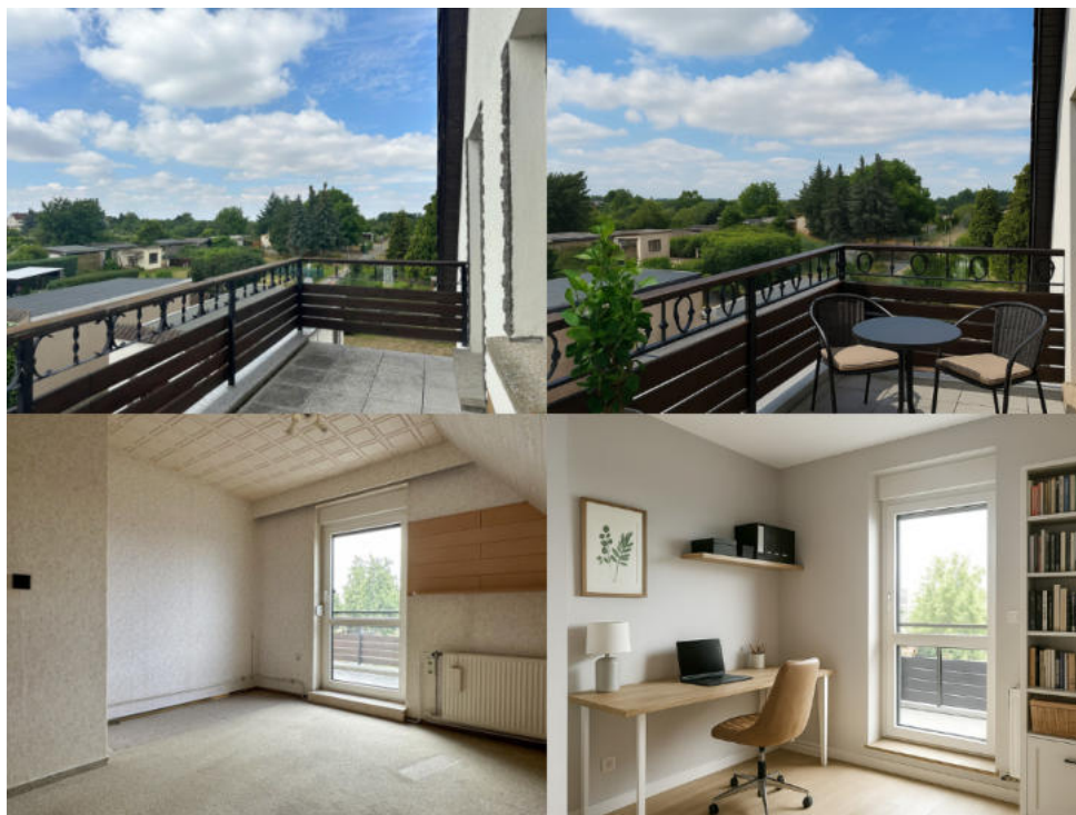
Renovierungsidee Arbeitszimmer und Balkon