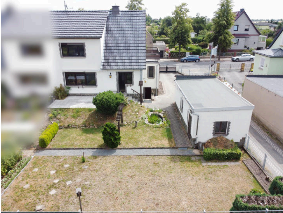
Hausrückseite mit Garten