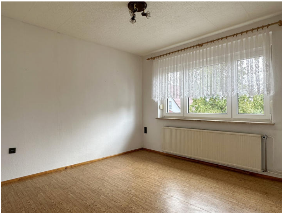
Kinderzimmer im Obergeschoss