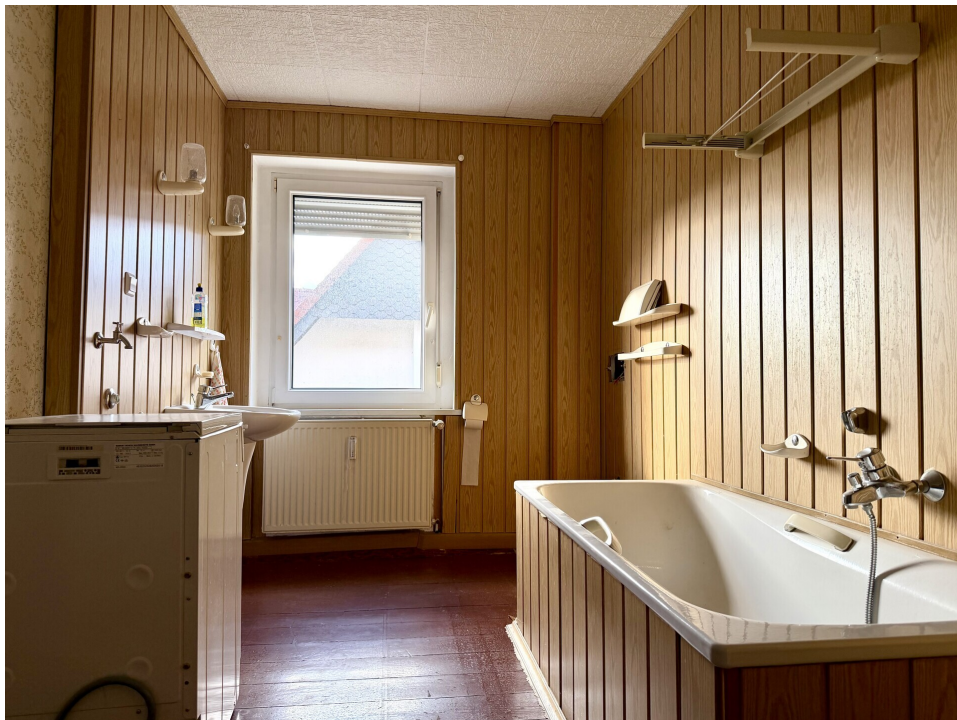
Bad 1. OG