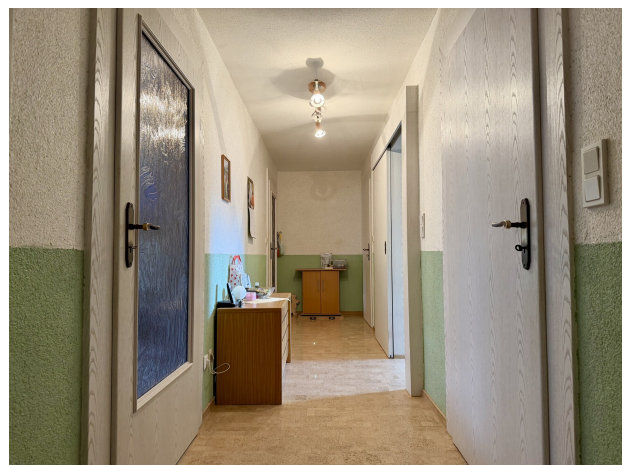
Flur 2. OG