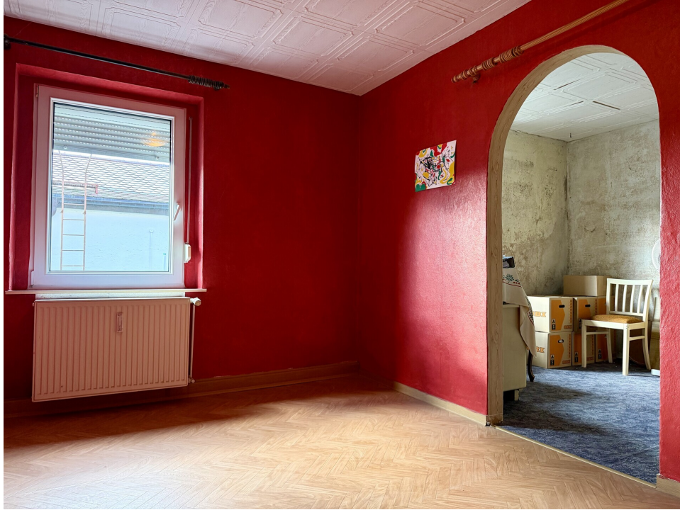
Schlafzimmer 1. OG