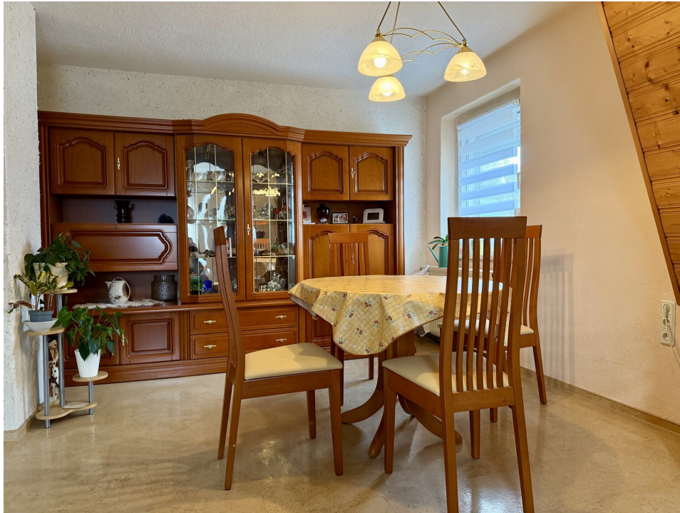
Essbereich im Wohnzimmer 2. OG