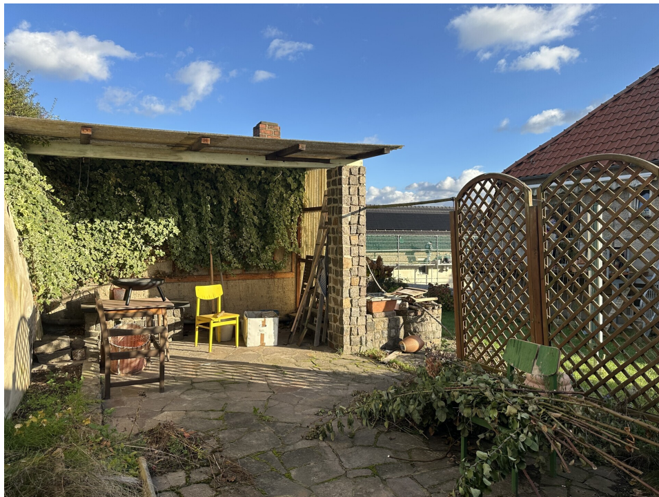
Terrasse im Garten