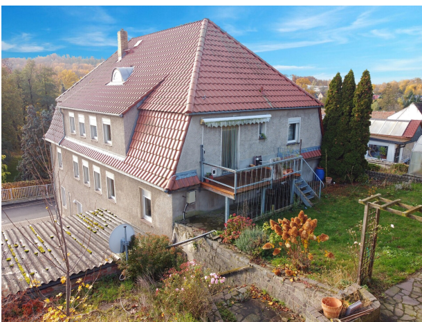
Hausrückseite mit Garten