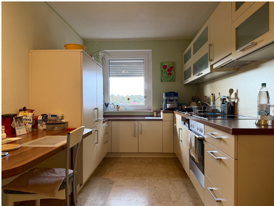
Küche 2. OG