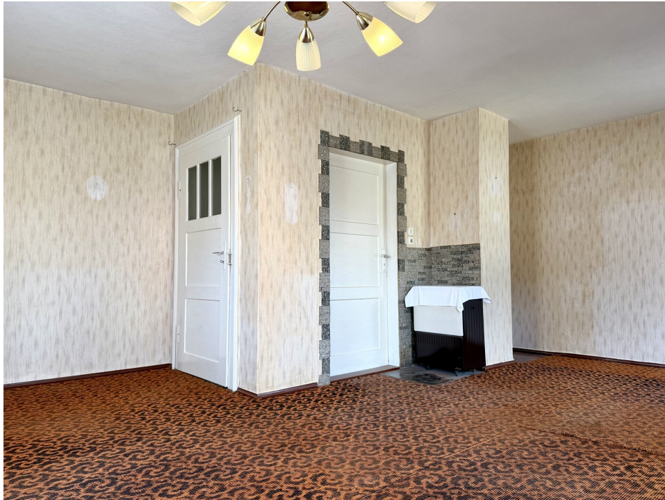
Wohnzimmer 1. OG