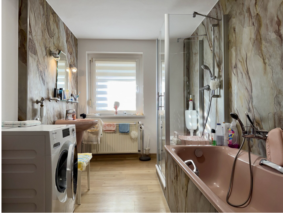
Bad 2. OG