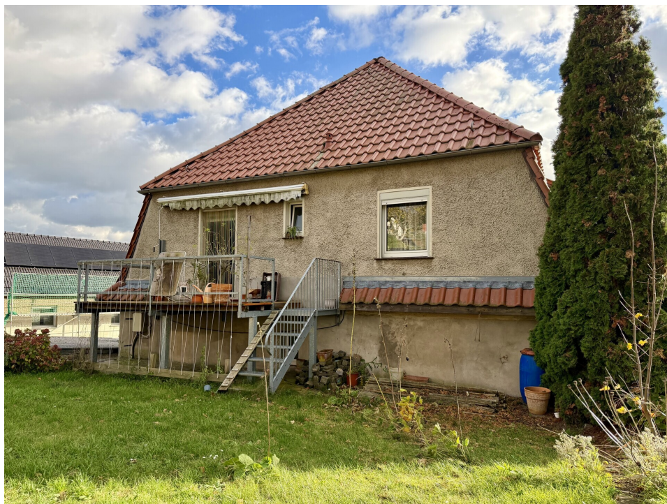
Hausrückseite mit Balkon