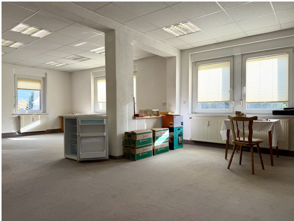
ehemalige Gewerbeeinheit EG