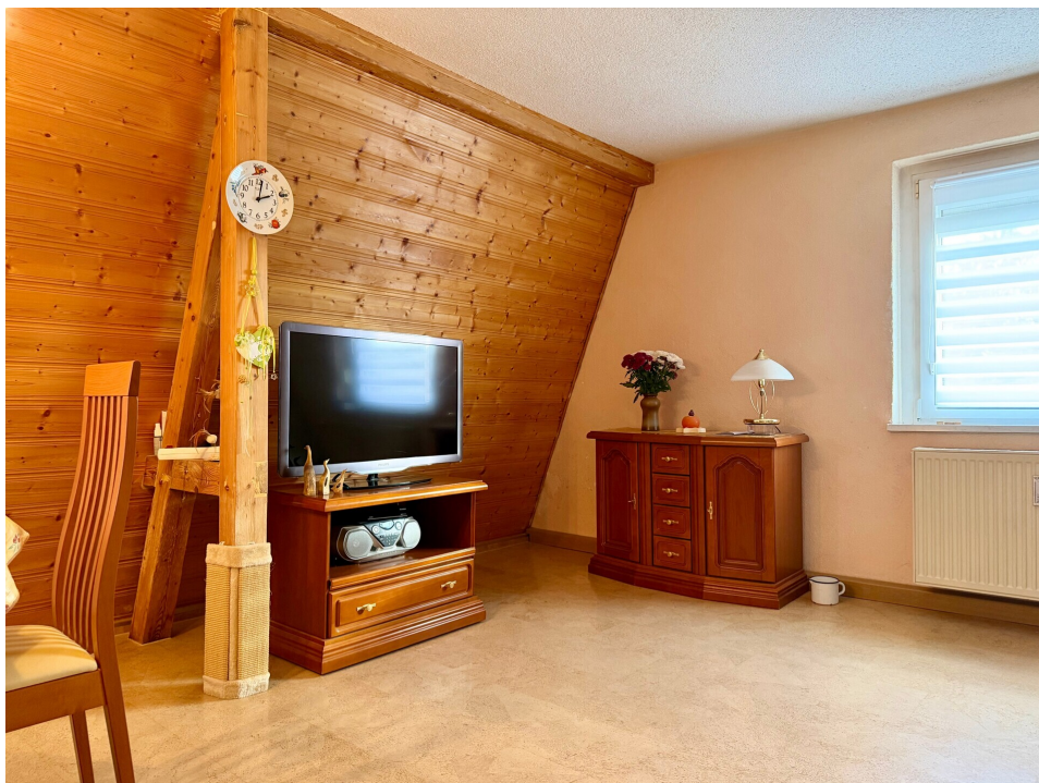
Wohnzimmer 2. OG