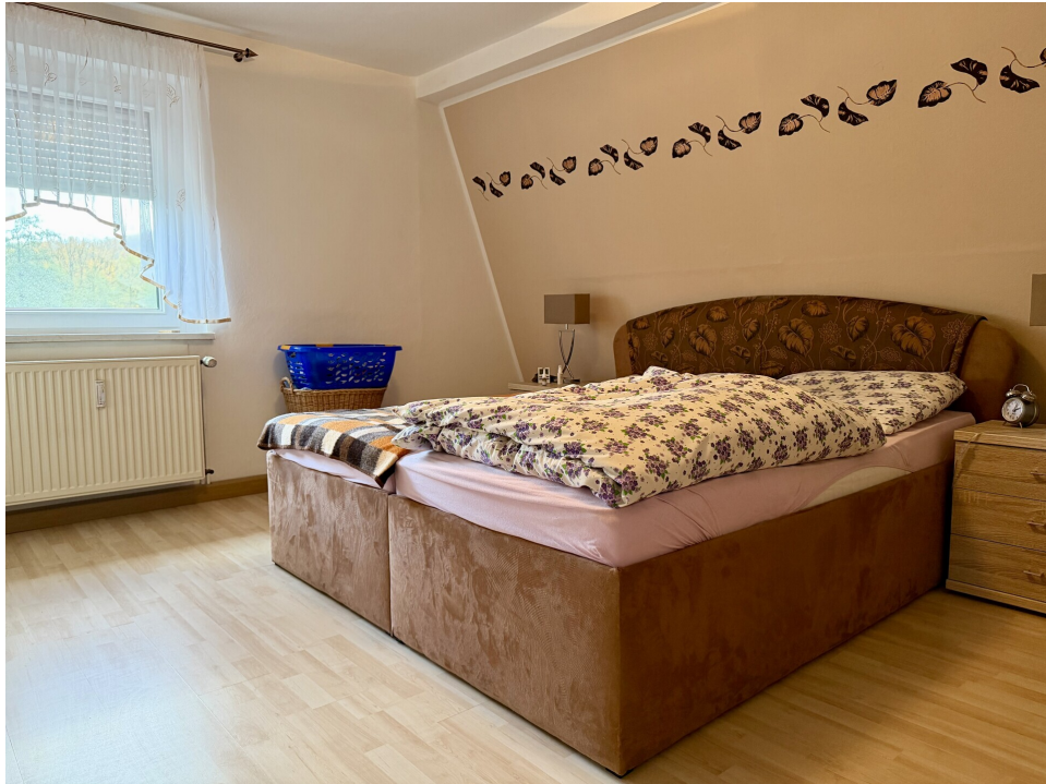
Schlafzimmer 2. OG