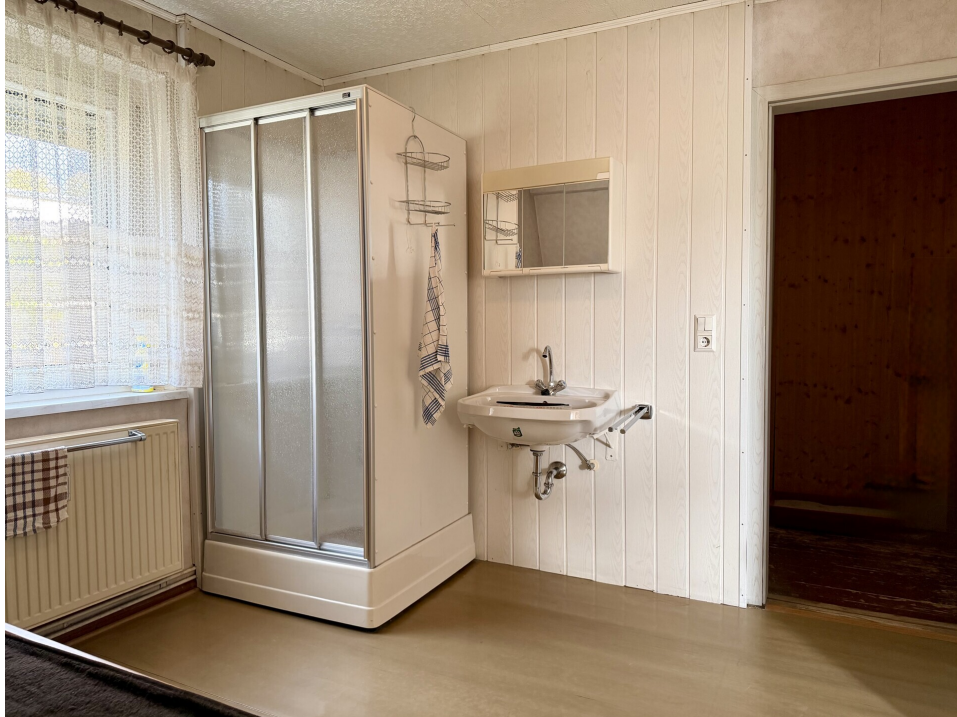
Gästezimmer mit Dusche 2. OG