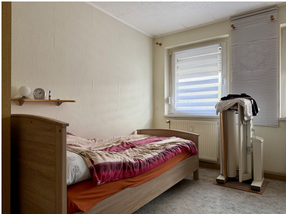
Kinderzimmer 2. OG