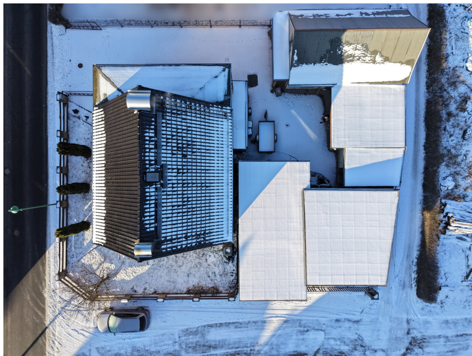
Ihr neues Zuhause aus der Luft