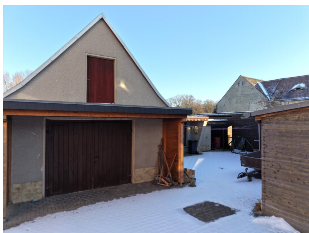
Innenhof mit Garagen