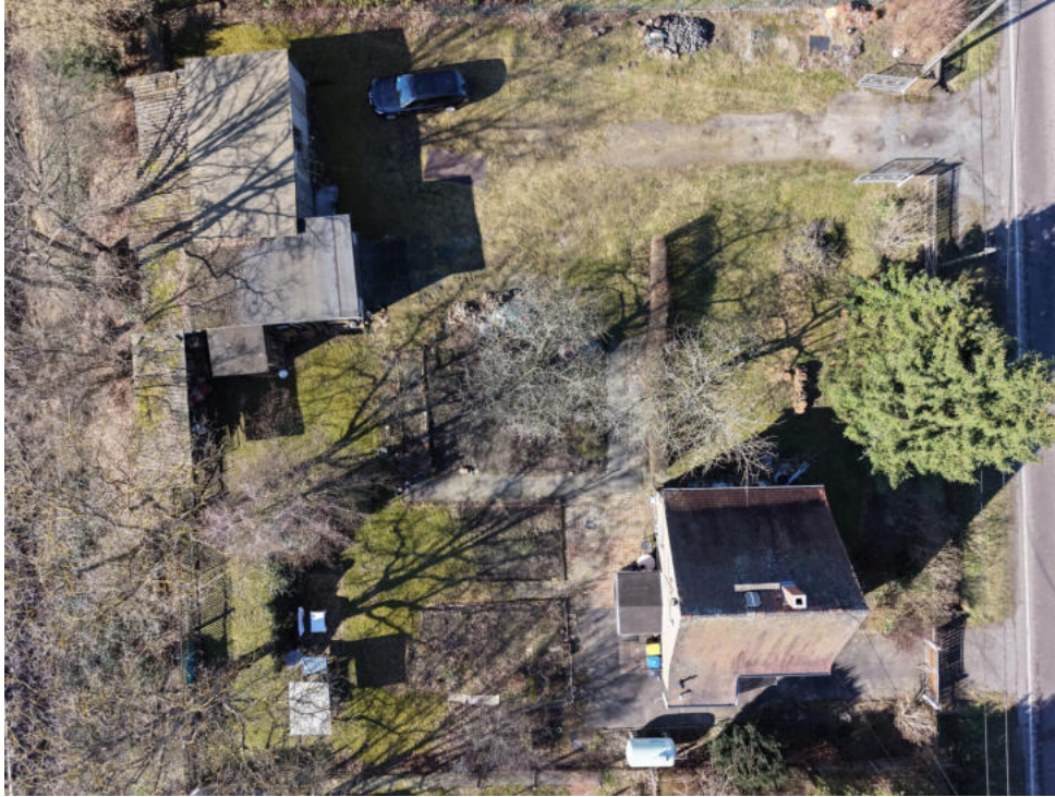
Ihr neues Zuhause aus der Luft