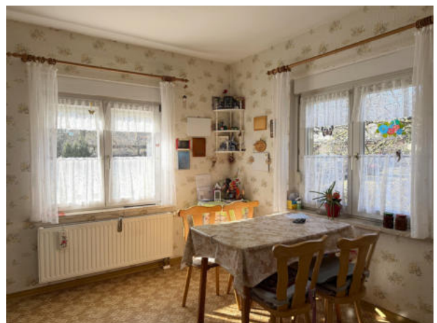
Essbereich in der Küche