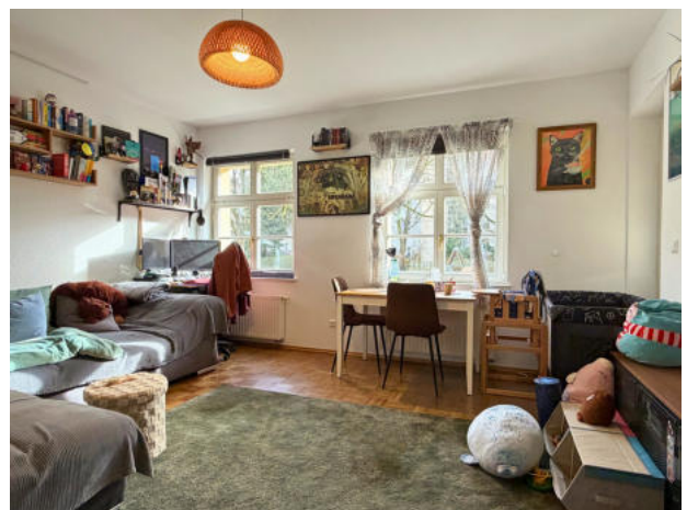
Wohnzimmer mit Zugang zur Loggia