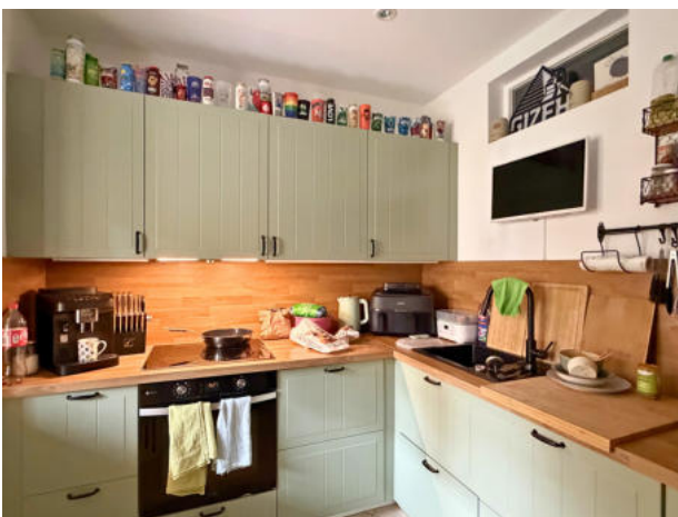
Küche mit Zugang zur Loggia