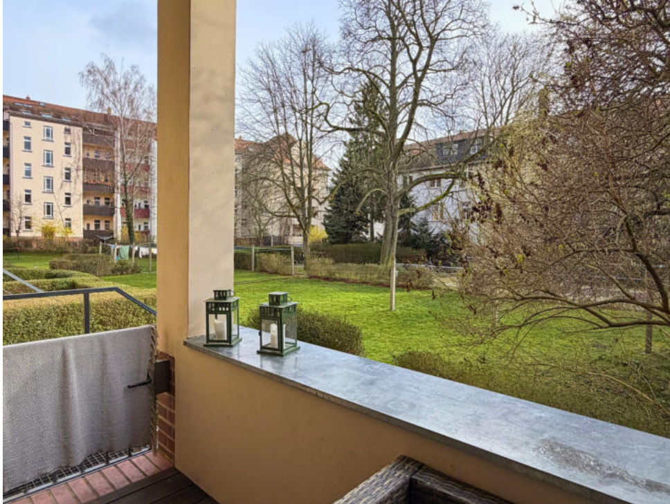
Loggia mit Zugang zum Garten