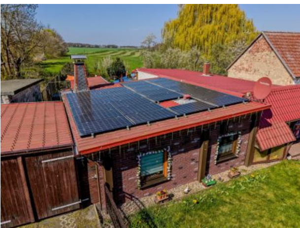
Photovoltaikanlage mit 7kWh