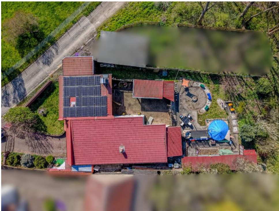
Ihr neues Zuhause aus der Luft