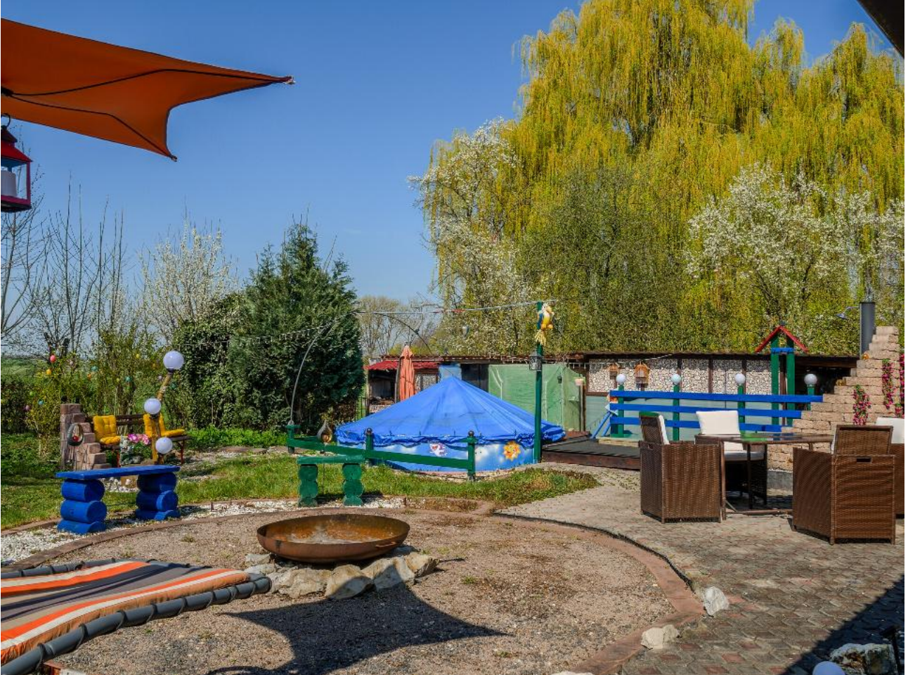
Gartenbereich mit Pool und Feuerstelle