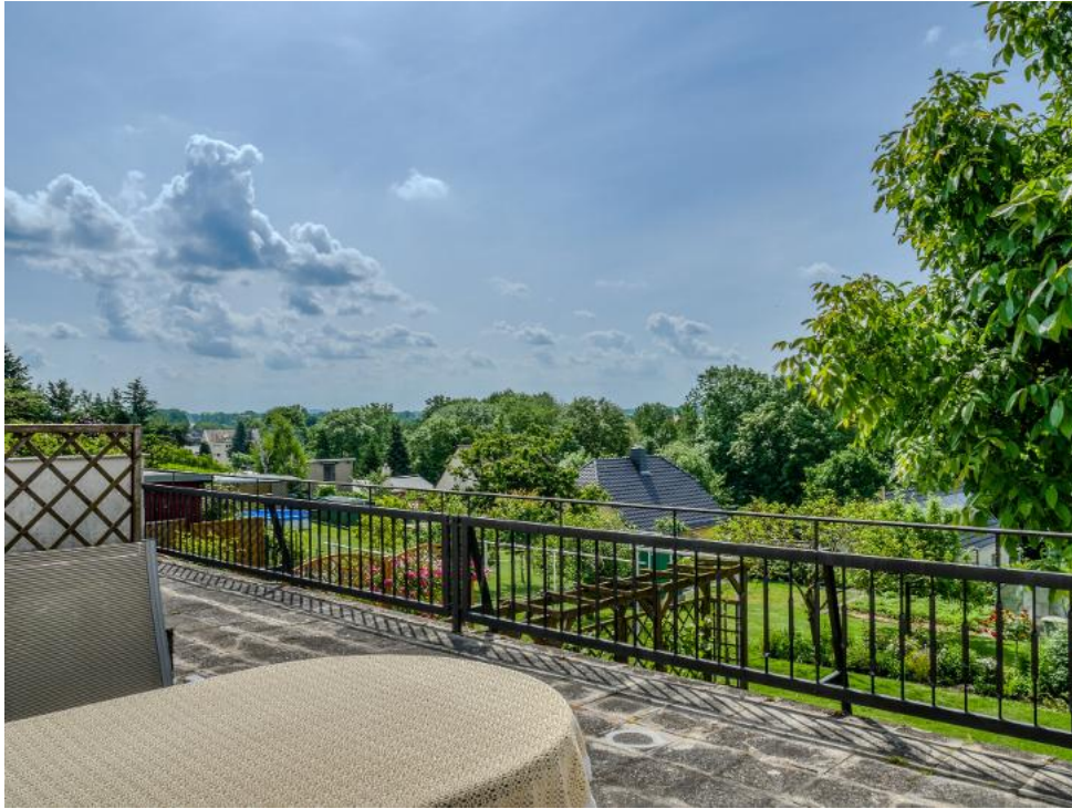
Sitzbereich auf der Terrasse