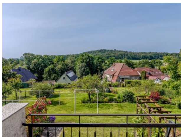
Ausblick von der Terrasse