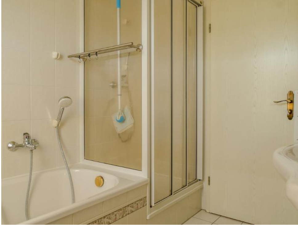
Badezimmer mit Wanne & Dusche