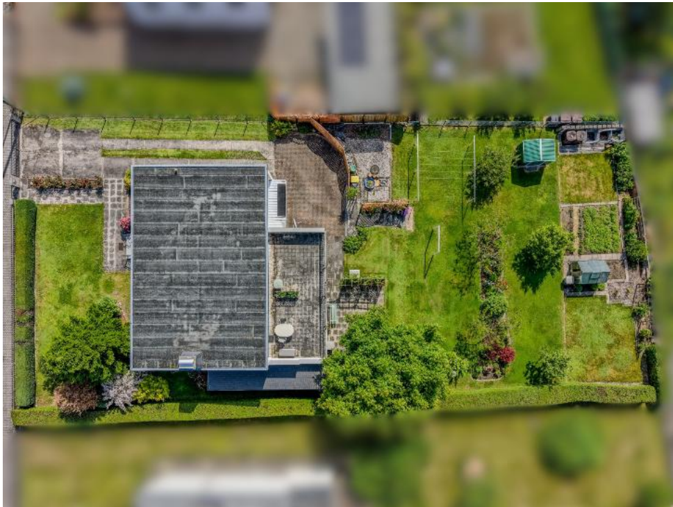
Ihr neues Zuhause aus der Luft