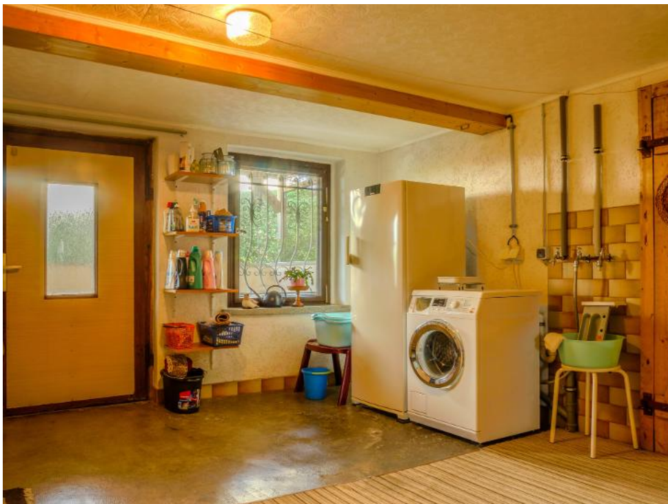
Waschraum im Keller