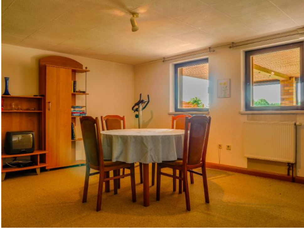
Hobbyraum im Keller